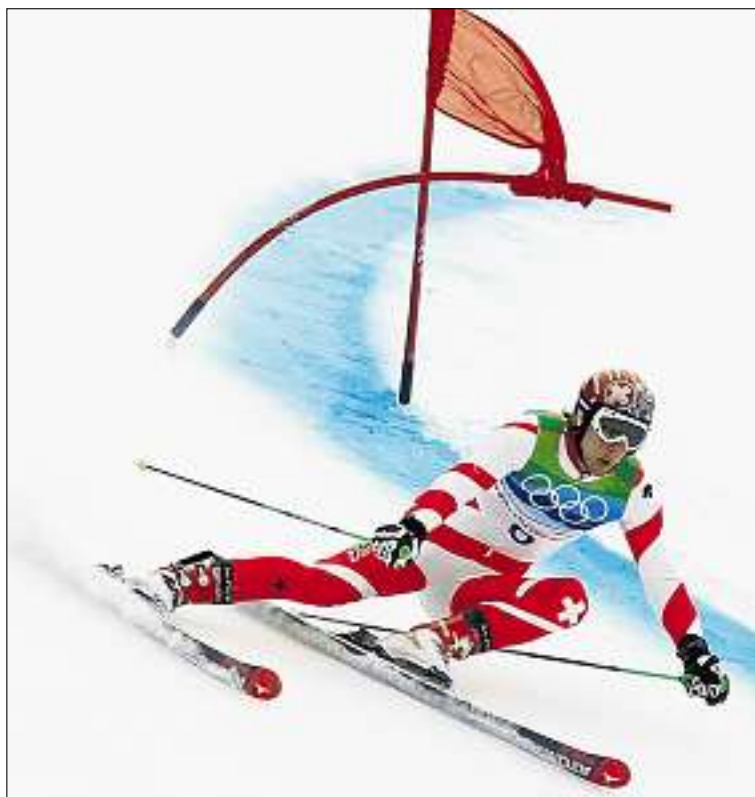
Auf der Fahrt zu Olympia-Gold: Carlo Janka siegt im Riesenslalom in Whistler Mountain. (Ky)